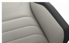
Кожа "Vienna" Mistral/ Grigio (VD)