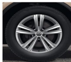
Алу фелни Sebring 19" 8.5Jx19, Гуми 255/55 R19