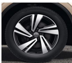
Алу фелни Nevada 20" 9Jx20, Гуми 285/45 R20