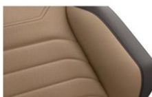
Кожа "Vienna" Atacama/Raven (YF)