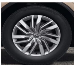
Алу фелни Osorno 19" 8Jx19, Гуми 255/55 R19