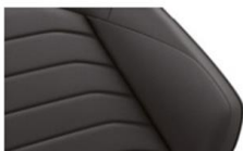
Кожа "Vienna" Soul (VM)