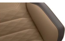
Кожа "Savona" Atacama/Raven (YF)