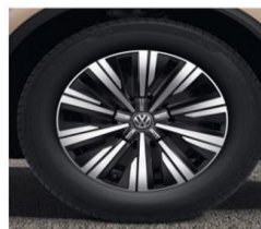
Алу фелни Tigrano 19" 8.5Jx19, Гуми 255/55 R19