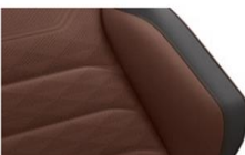
Кожа "Savona" Florence/Soul (YV)