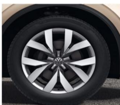
Алу фелни Montero 20" 9Jx20, Гуми 285/45 R20