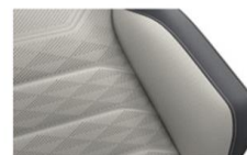
Кожа "Savona" Mistral/ Grigio (VD)