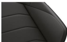
Текстил "Graphite" Soul (VM)