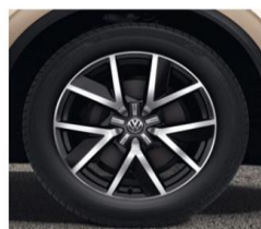
Алу фелни Braga 20" 9Jx20, Гуми 285/45 R20