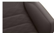
Кожа "Savona" Raven (VV)