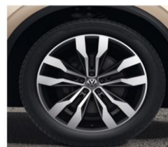
Алу фелни Suzuka 21" 9.5Jx21, Гуми 285/40 R21