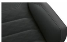
Кожа "Savona" Juniper/ Soul (YA)